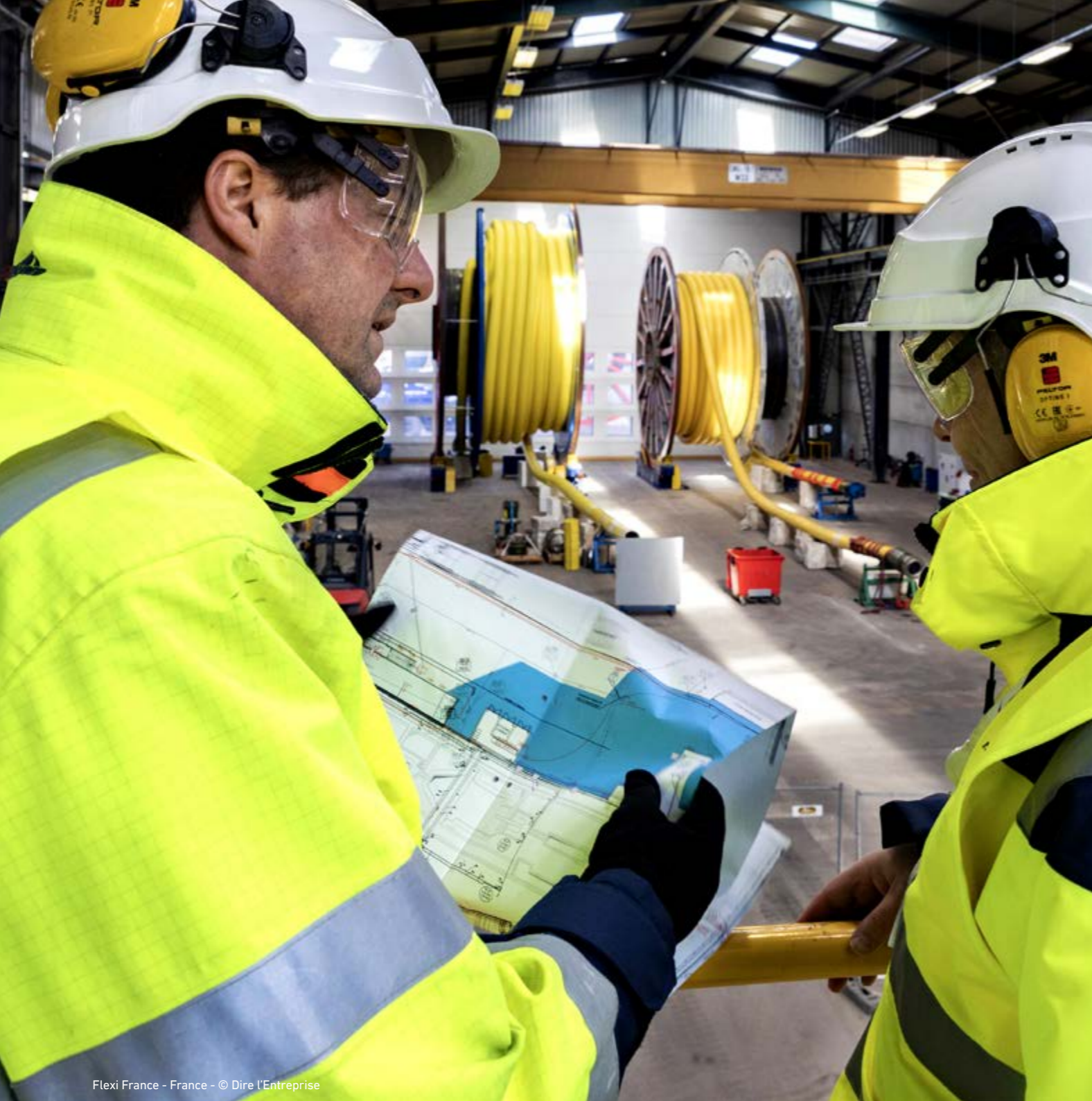
Flexi France - France