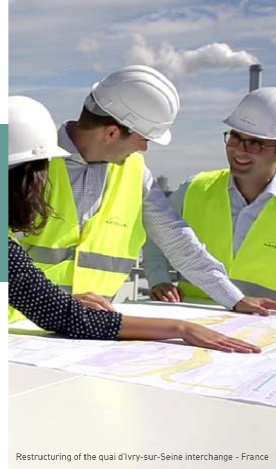
Restructuring of the quai d'Ivry-sur-Seine interchange - France

การอุปถัมภ์ทั้งหลายต้องถูกบันทึกไว้ในบัญชีของกลุ่มบริษัทที่เกี่ยวข้อง และต้องรายงานต่อฝ่ายจริยธรรมและความซื่อสัตย์ของกลุ่มบริษัทและหน่วยธุรกิจ