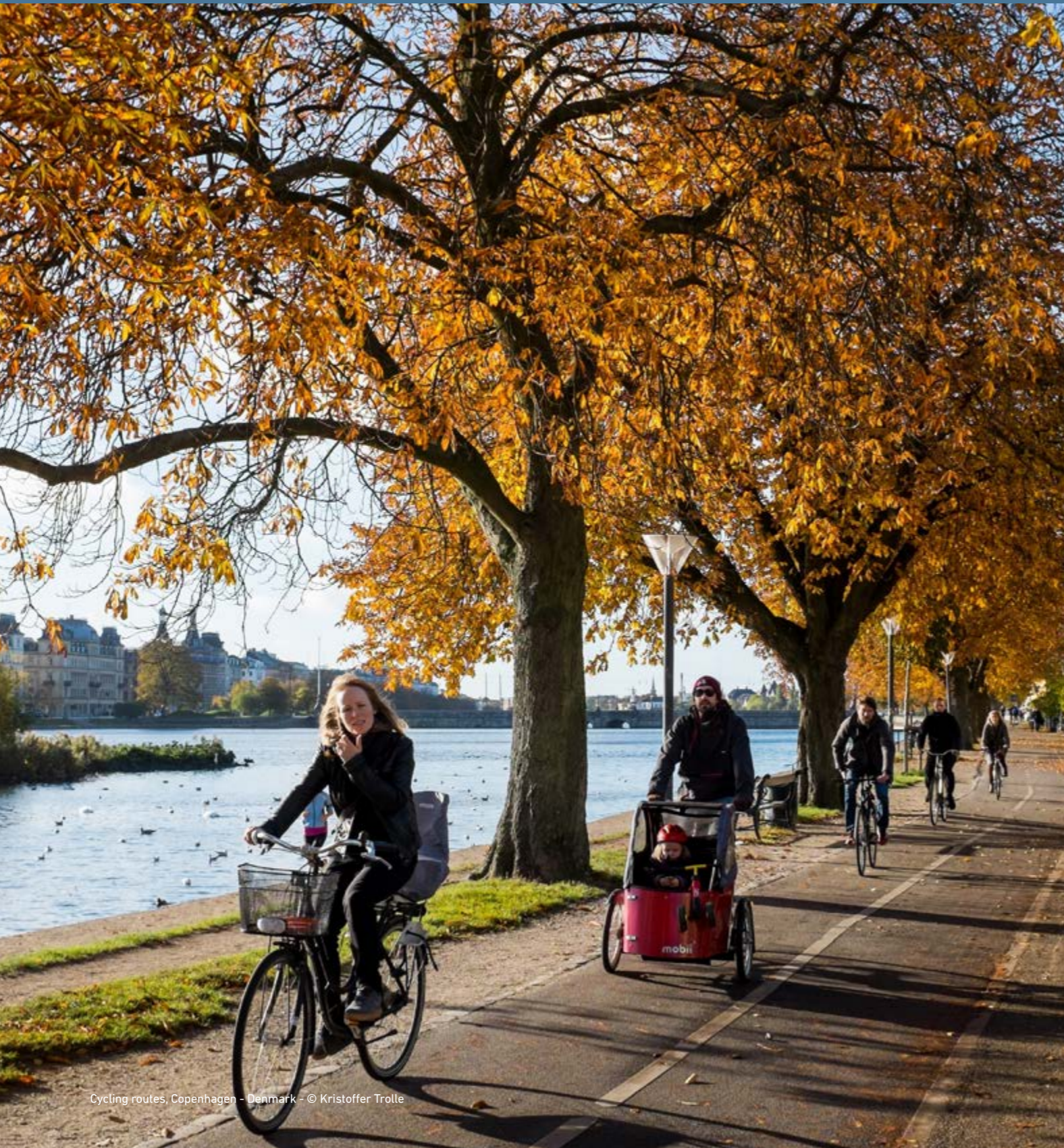
Cycling routes, Copenhagen - Denmark

Artelia เป็นกลุ่มอิสระ ดำเนินธุรกิจที่หลากหลาย (การจัดการโครงการ วิศวกรรม การให้คำปรึกษา ตรวจสอบ และบริการแบบเบ็ดเสร็จ) ในกิจการหลากหลายประเภท ทั้งการก่อสร้าง น้ำ พลังงาน สิ่งแวดล้อม อุตสาหกรรม การเดินเรือ การขนส่ง ระบบในเมืองและโครงการตามสถานที่ต่าง ๆ