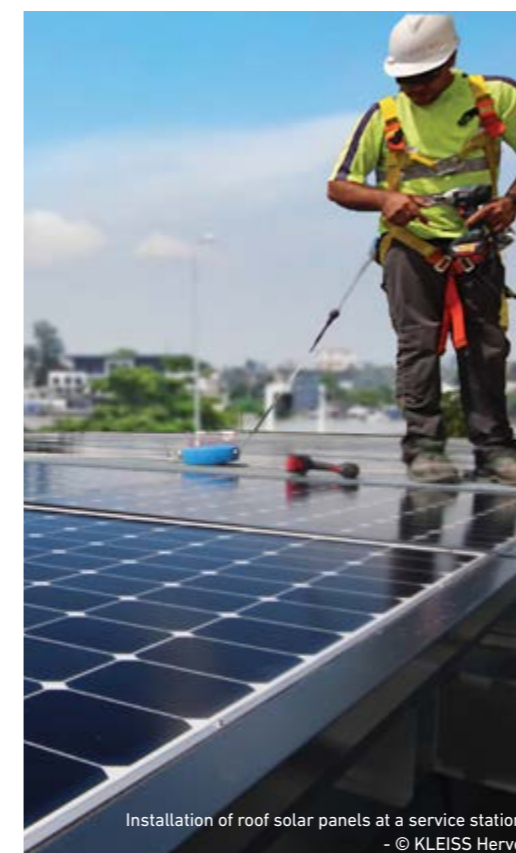
Installation of roof solar panels at a service station

หากเกิดข้อสงสัยหรือเกิดเหตุการณ์เช่นนี้ พนักงานต้องแจ้งให้ฝ่ายบริหารทราบทันที